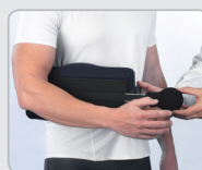
Balle d'exercice de la main pour maintenir le tonus musculaire et améliorer la circulation sanguine.